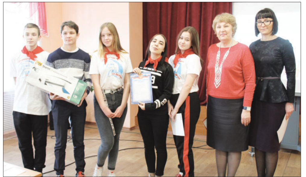
Проект «Шагает по земле Победа» фоминских волонтеров признан одним из лучших!